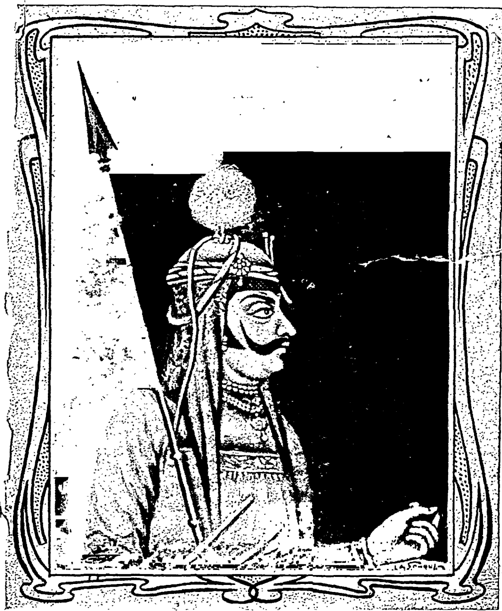
महाराणा प्रतापसिंह ।